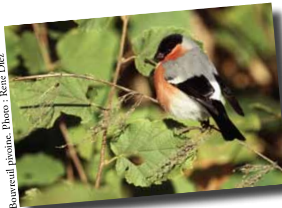
Bourreuil pivoine.