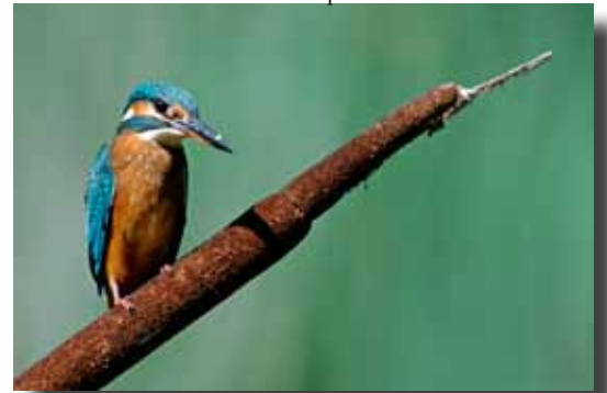
Martin pêcheur.