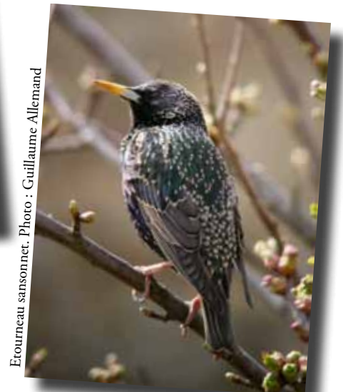
Etourneau sansonnet.