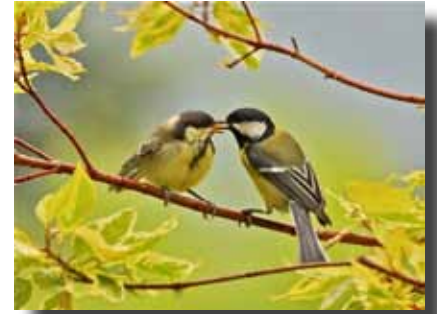
Mésange charbonnière.