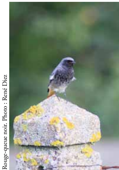
Rouge-queue noir.

Réseau Visionature = groupe d'observateurs qui échangent leurs observations au travers de bases de données en réseau (dont Faune-Loire), en France métropolitaine, dans les Dom-Tom, mais aussi dans plusieurs autres pays en Europe. L'identifiant et le mot de passe utilisés sur Faune-Loire sont uniques et fonctionnent sur tous les sites du réseau Visionature, sans avoir à se réinscrire à chaque fois ( http://www.ornitho.fr/ ou http://www.faune-alsace.org/index.php?m_id=20234 )